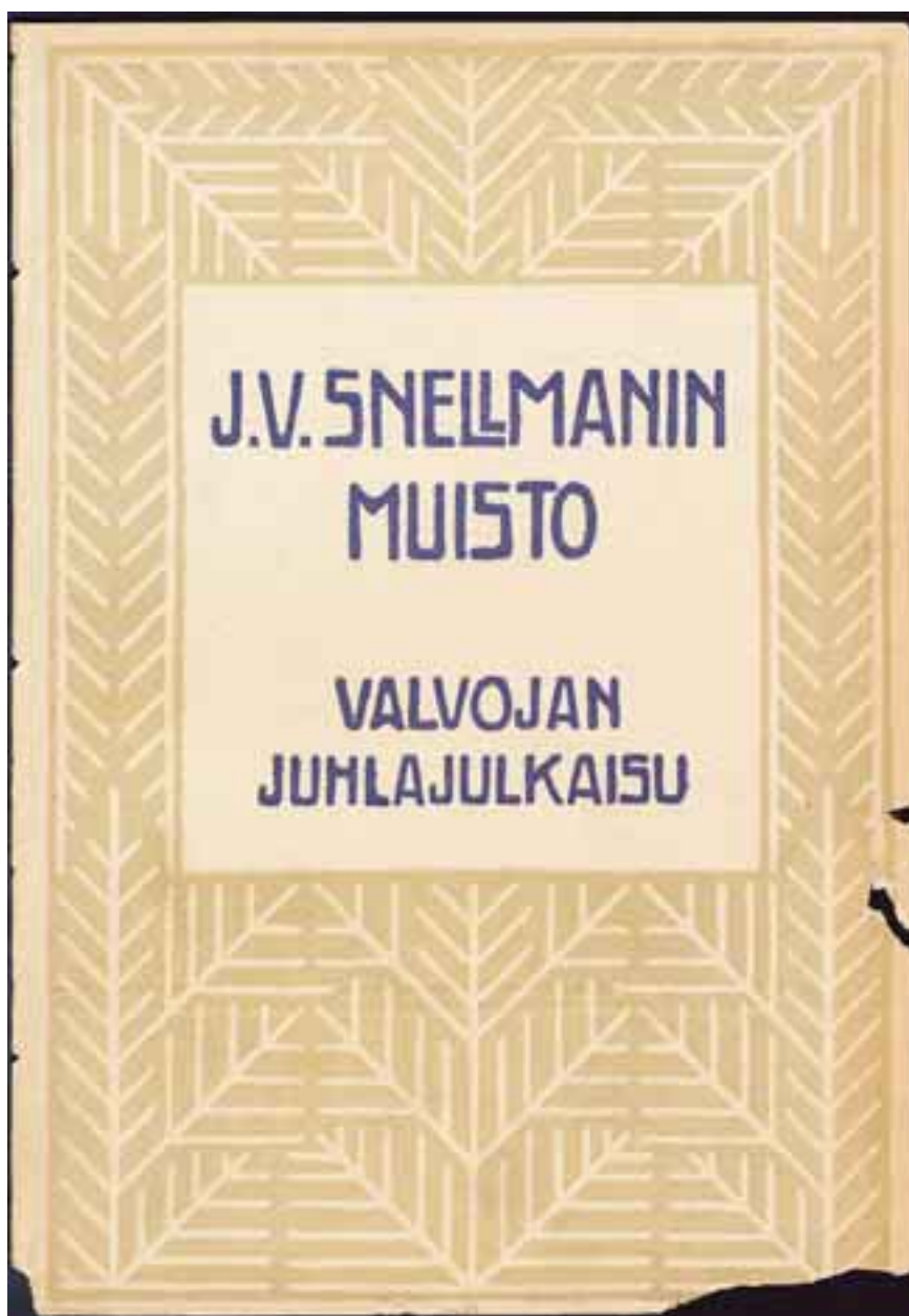
Valvoja-lehden toukokuun 1906 numero löytyy muun muassa Helsingin yliopiston kirjastosta.